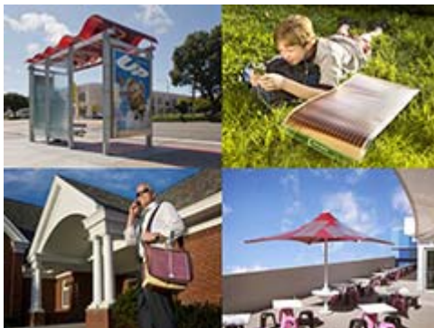
Aktuelle Beispiele für Produkte mit integrierten organischen Solarzellen.